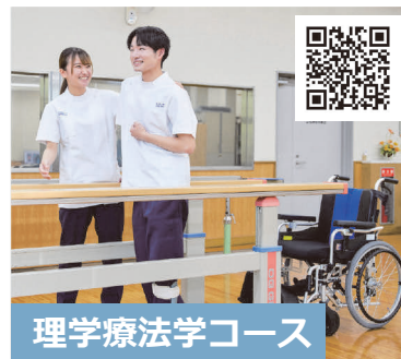
理学療法学コース

看護学コースでは、既習の知識や技術に基づき、対象者の身体面、精神面、それらを取り巻く環境、ニーズなど多角的な側面からアセスメントし、対象者にとって最適な援助方法を考え、デモンストレーションを行っています。他コースの学生への看護実践の説明を通して、看護の専門性について改めて考える機会となっています。