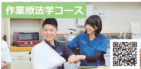
作業療法学コース

理学療法学コースでは、運動療法や物理療法で使用する各種機器の説明や装具や杖などの使い方についてデモンストレーションを行っています。さらに、本演習で検討する症例について、評価結果の解釈や介助の仕方なども実技を交えて説明しています。