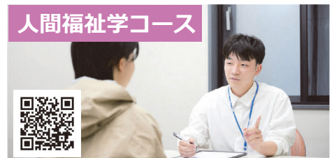
人間福祉学コース

コミュニケーション障害学コースでは、小児の言語発達検査、知能検査、成人の失語症、摂食嚥下障害の検査や訓練について紹介しています。コミュニケーション障害は、小児から成人まで幅広い年代に起こり、症状も多岐にわたります。写真は失語症検査について説明している場面です。