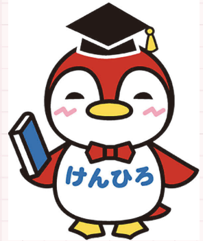
アビー教授 県立広島大学キャラクター

学校生活やおすすめの授業、大学に入って成長したこと、これからの目標について5コースの学生さんたちに聞いてみました！