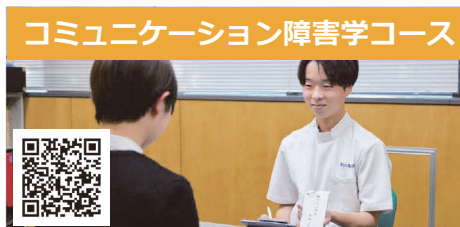
コミュニケーション障害学コース

作業療法学コースでは、実際に使用する評価や自助具の使い方を実演します。写真は自助具のスプーン、まな板などの調理器具を使用したり、それを支援している場面です。演習授業を通して、その人自身にとって大切な活動（作業）を特定し、作業を治療的に活用する方法を一緒に学びます。